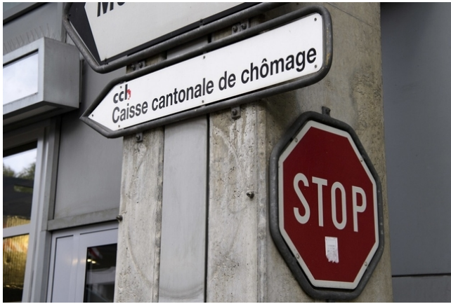
Un chômeur aurait droit à une rente si sa fortune nette est inférieure à 50'000 francs.

Suisse Une commission du Conseil des Etats se rallie à l'avis du National pour soutenir les chômeurs âgés.