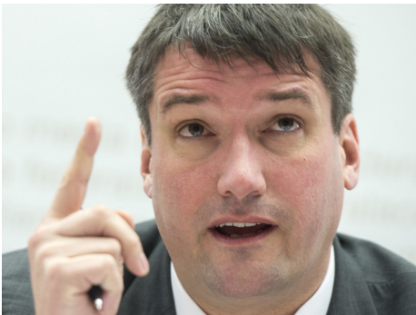
Christian Levrat, Tribune de Genève, 26-27 mai 2018