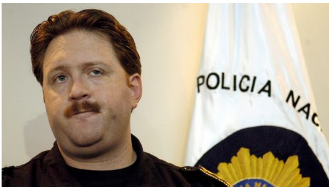
Erwin Sperisen possède la double nationalité suisse et guatémaltèque.

La détention de l'ancien chef de la police guatémaltèque Erwin Sperisen a été prolongée jusqu'au 26 février 2013 par la justice genevoise. Le prévenu est soupçonné d'avoir participé à des assassinats au Guatemala.