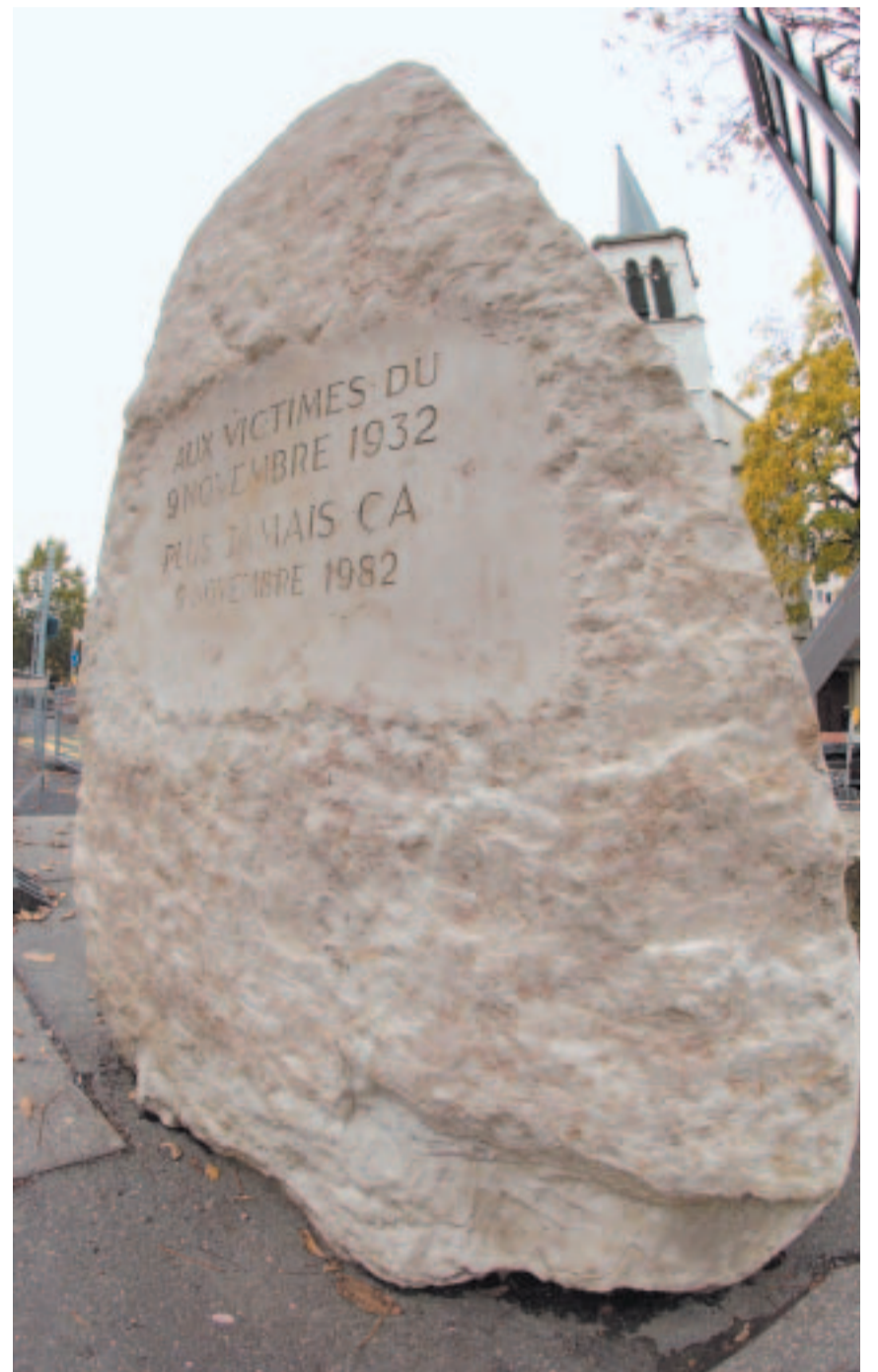
Le monument de Plainpalais rappelant le 9 novembre 1932.