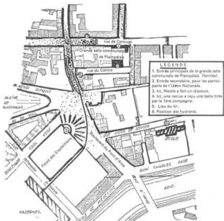
Plan de situation par R. Gaudet-Blavignac.

Le devoir de mémoire exige que l'on se souvienne de cette tragédie afin qu'elle ne se reproduise plus jamais.