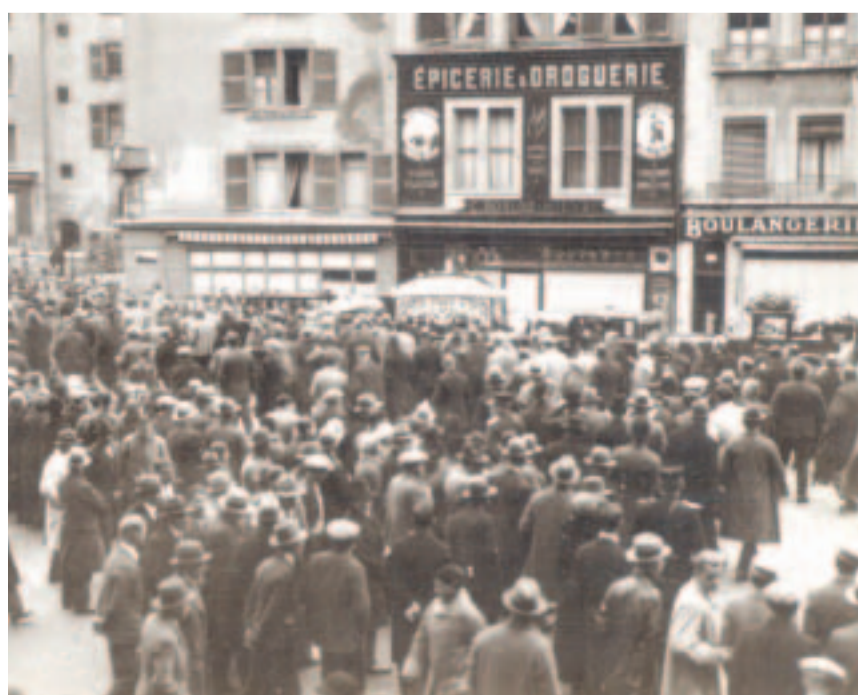
Les obsèques des victimes.