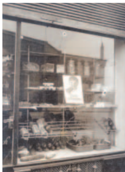
Une vitrine du quartier de Plainpalais après les événements.